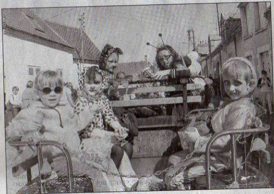
Les enfants en voiture...