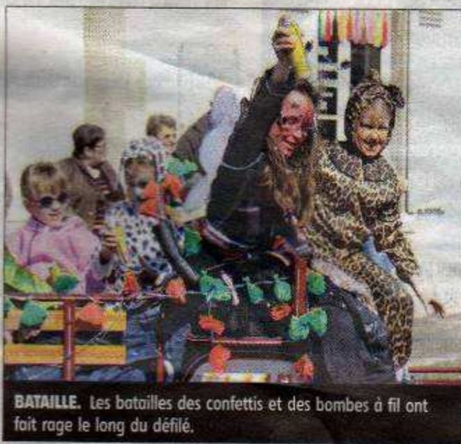
BATAILLE. Les batailles des confettis et des bombes à fil ont fait rage le long du défilé.

Mais c'est bien connu, il renaît toujours de ces cendres. Rendez-vous l'an prochain pour une 17 e édition. ■