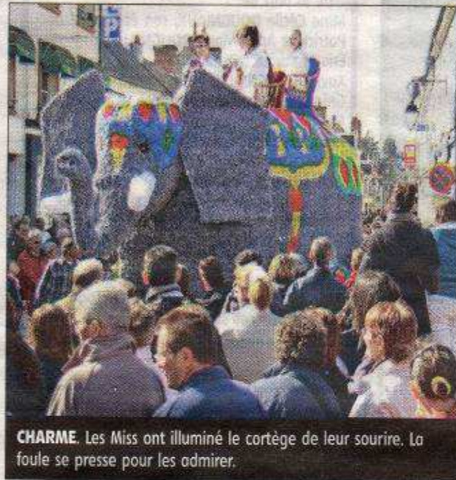
CHARME. Les Miss ont illuminé le cortège de leur sourire. La foule se presse pour les admirer.

Au son des musiques enjouées des bandas, notamment des tambours des Bombos du Portugal, les