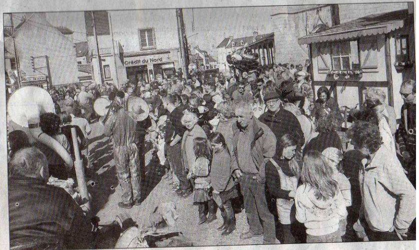
La foule dans les rues de Châteauneuf-sur-Loire