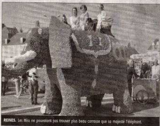
REINES. Les Miss ne pouvaient pas trouver plus beau carrosse que sa majesté Téléphant.