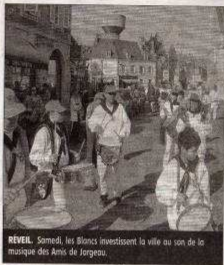
REVEIL. Samedi, les Blancs investissent la ville au son de la musique des Amis de Jargeau.