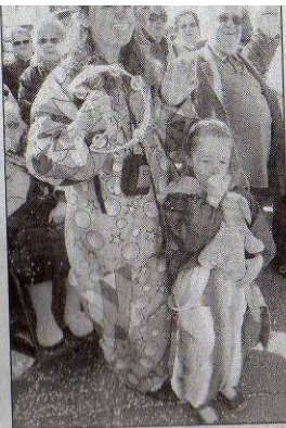
Mère et fille