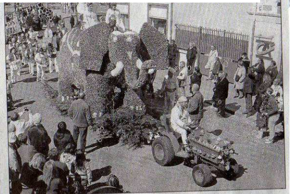
L'éléphant était bien de retour sur le cotège mais tiré par un micro-tracteur