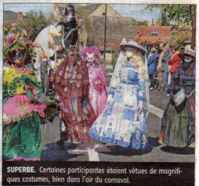
SUPERBE. Certaines participantes étaient vêtues de magnifiques costumes, bien dans l'air du carnaval.