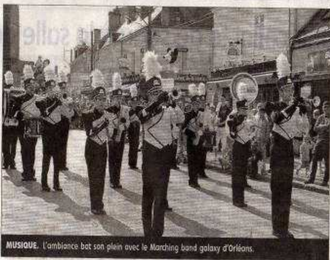
MUSIQUE. L'ambiance bat son plein avec le Marching band galaxy d'Orléans.