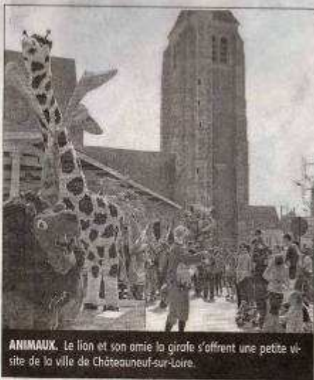
ANIMAUX. Le lion et son amie la girafe s'offrent une petite visite de la ville de Châteauneuf-sur-Loire.