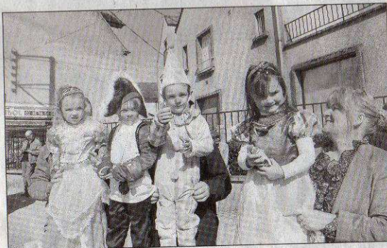
... d'autres à pied