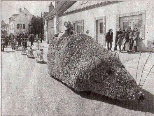
La souris géante poursuivie par trois petit chats